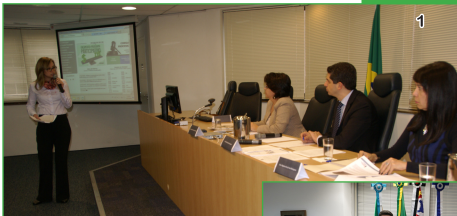
Foto 1: Audiência pública sobre orçamento participativo em 15/12/16

Agora, a Secretaria de Orçamento e Finanças do TRF3 vai reunir as propostas do 1ª e 2ª Graus, e encaminhar, em documento único, ao Conselho da Justiça Federal.